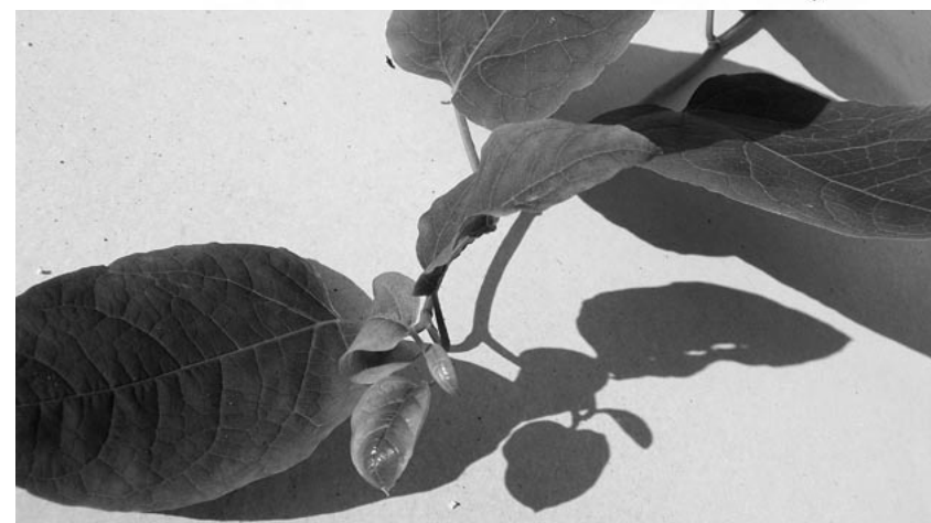
Křídlatka česká (Reynoutria x bohemica) je kříženec křídlatky japonské a křídlatky sachalinské, který byl poprvé popsán v roce 1983 z lokality nedaleko lázní Běloves u Náchoda. Šíří se rychleji než rodičovské druhy.